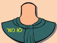
פתח הצוואר רחב אינו מכסה כדין