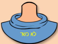
פתח הצוואר פתוח מדי