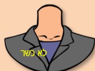
אין הצווארון מכסה כהלכה

השל"ה הקדוש כותב שאותם בגדים שלובשים פה בעולם הזה, אותם בגדים לובשים שם בעולם האמת. ואם חסר בגד לנשמה זה לנצח נצחים. אם אישה הולכת לא צנוע כגון: בגד צר, קצר, צווארון פתוח, גרביים שקופות בצבע רגל או פאה יחסרו לה בגדים לנשמה, ואת הצער אי אפשר לתאר, ולעומת זאת, את השכר על כל רגע ורגע שלבושה כראוי, גם כן אי אפשר לתאר.