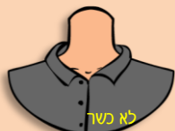
יש להוסיף סיסט בטחון כעספת לכפתור העליון שאינו מכסה כדין