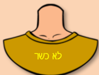
פתח הצוואר פתוח מדי