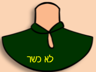
יש לסגור את הפתח ע"י עליון מאחור