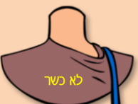
תיק הצד מושך את הצווארון ומושך את הכתף