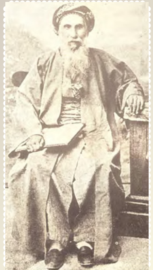
מרן הגאון הקדוש רבי אברהם הלל זצ"ל

"דאסור ללבוש מכנסיים אם לא עשוין כבתי שוקיים..." (רמ"א אבהע"ז כג, ו')