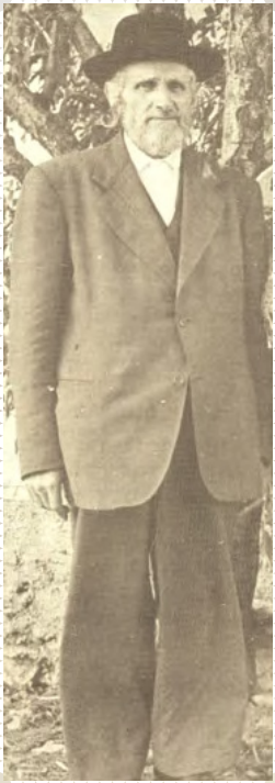
הצדיק רבי ישראל יצחק משי זהב זצ"ל