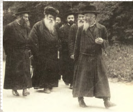
כ"ק מרן האדמו"ר מבעלז זצ"ל עם תלמידיו

וכתב המאירי (שם) מכנסיים אסורים... אלא שעושין אותן רחבות הרבה עד שאין בו סמיכות בשר כלל.